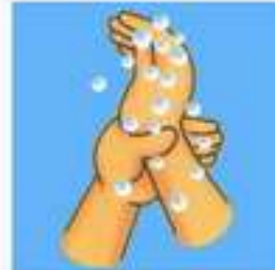
ท่าที่ 7 ฝ่ามือรอบข้อมือ (ขมไล่ออก)