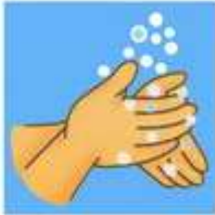
ท่าที่ 1 มือถูมือ (ขมเป็นรูป)