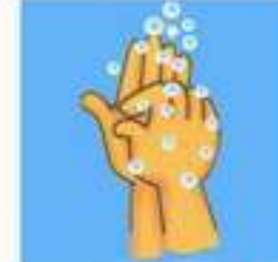
ท่าที่ 6 ประกบนิ้วดูข้อมือ (ขมจับ)