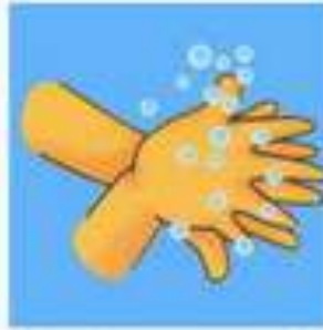
ท่าที่ 2 ฝ่ามือถูหลังมือ (ขมข้าง)