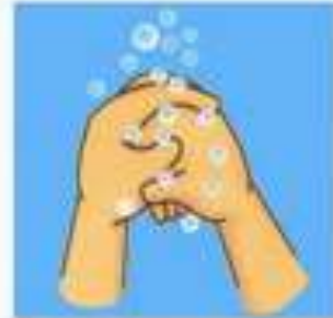
ท่าที่ 4 นิ้วถูหลังมือ (ขมขบ)