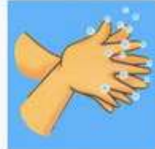
ท่าที่ 3 ถูข้อมือ (ขมสอดใส่)