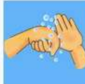
ท่าที่ 5 หมุนรอบนิ้วมือ (ขมถอยหมุน)