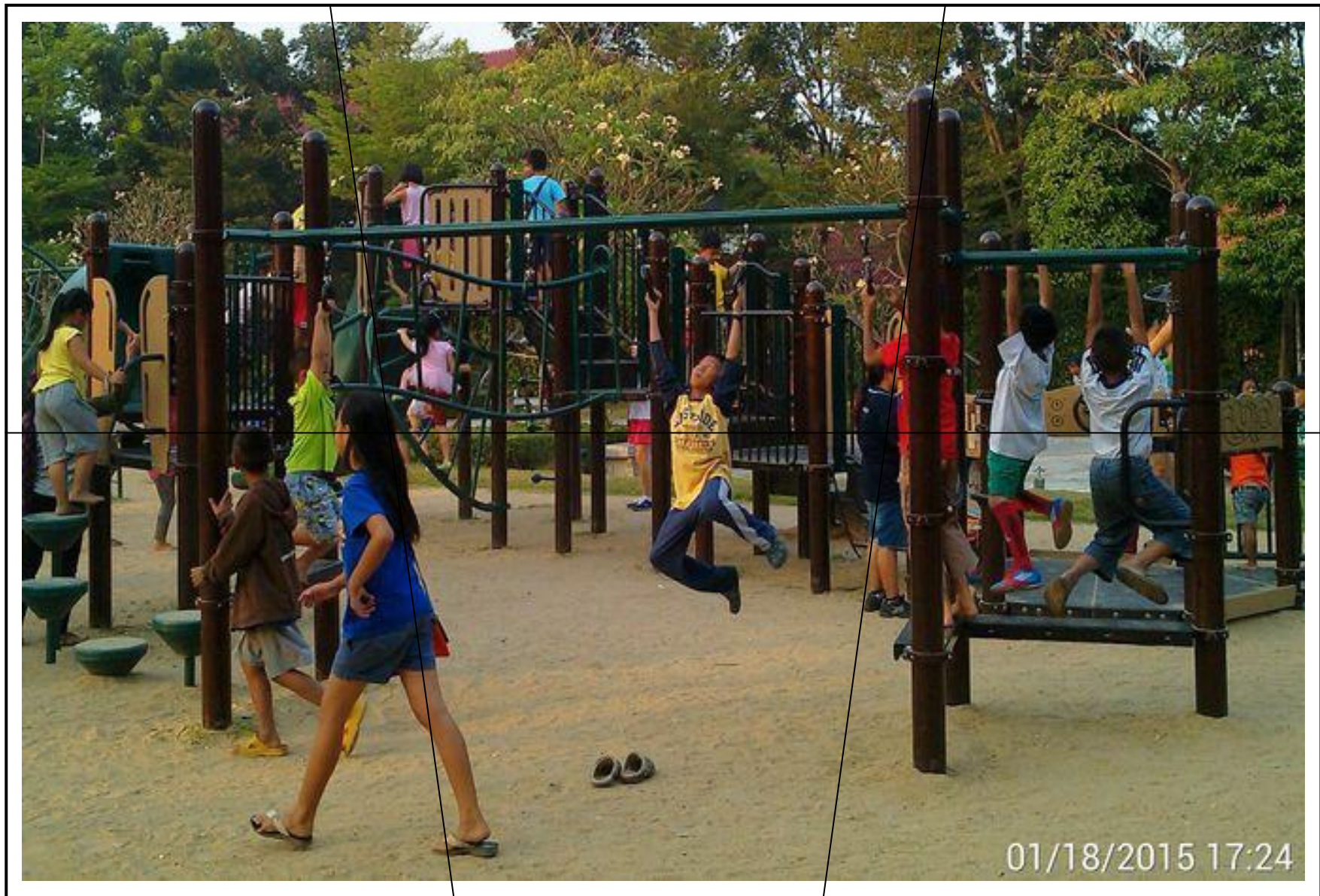
หน่วย ชุมชนของเรา เกมภาพตัดต่อ “สนามเด็กเล่นในชุมชน”