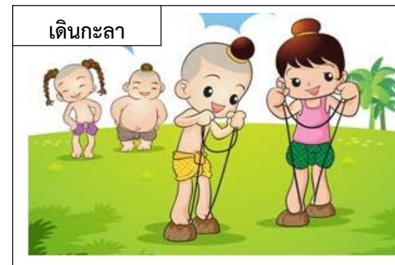
เดินกะลา