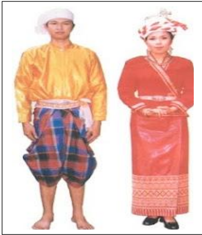
ภาคเหนือ