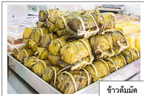
ข้าวต้มมัด