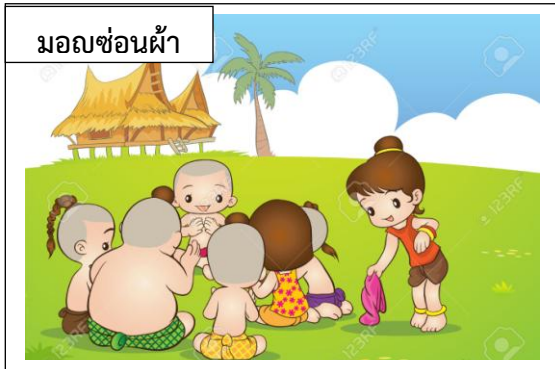
มอญซ่อนผ้า