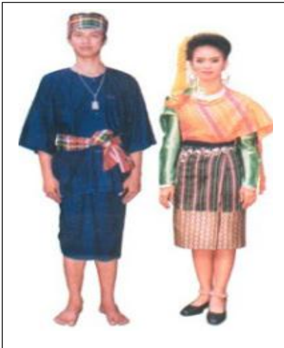
ภาคอีสาน