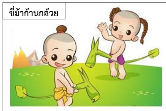
ขี่ม้าก้านกล้วย