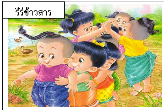
รื้อข้าวสาร